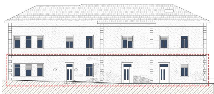
STATO DI PROGETTO PROSPETTO NORD-OVEST Scala 1:100