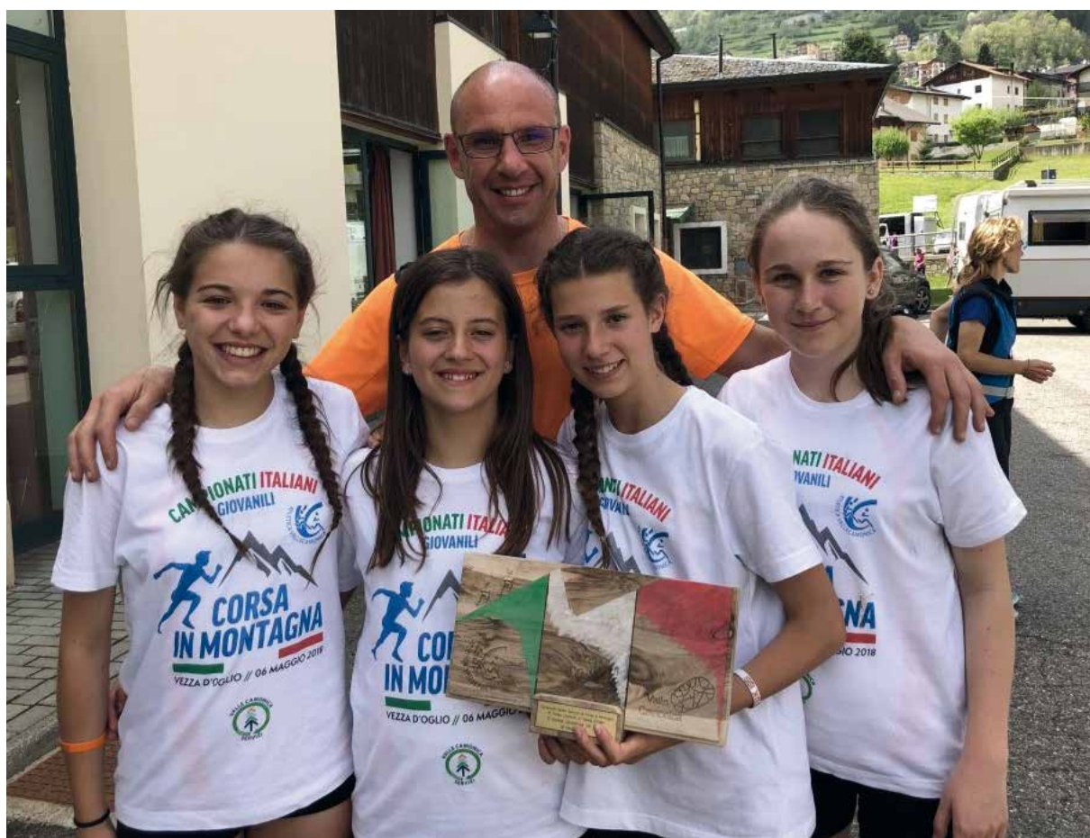
VeZZa d'Oglio (BS), 6 maggio 2018 - Medaglia di Bronzo AVDC Campionato Italiano di Corsa in Montagna Giovanile cadette

cell. 333.5229088 antonio@studiotecnopiu.it