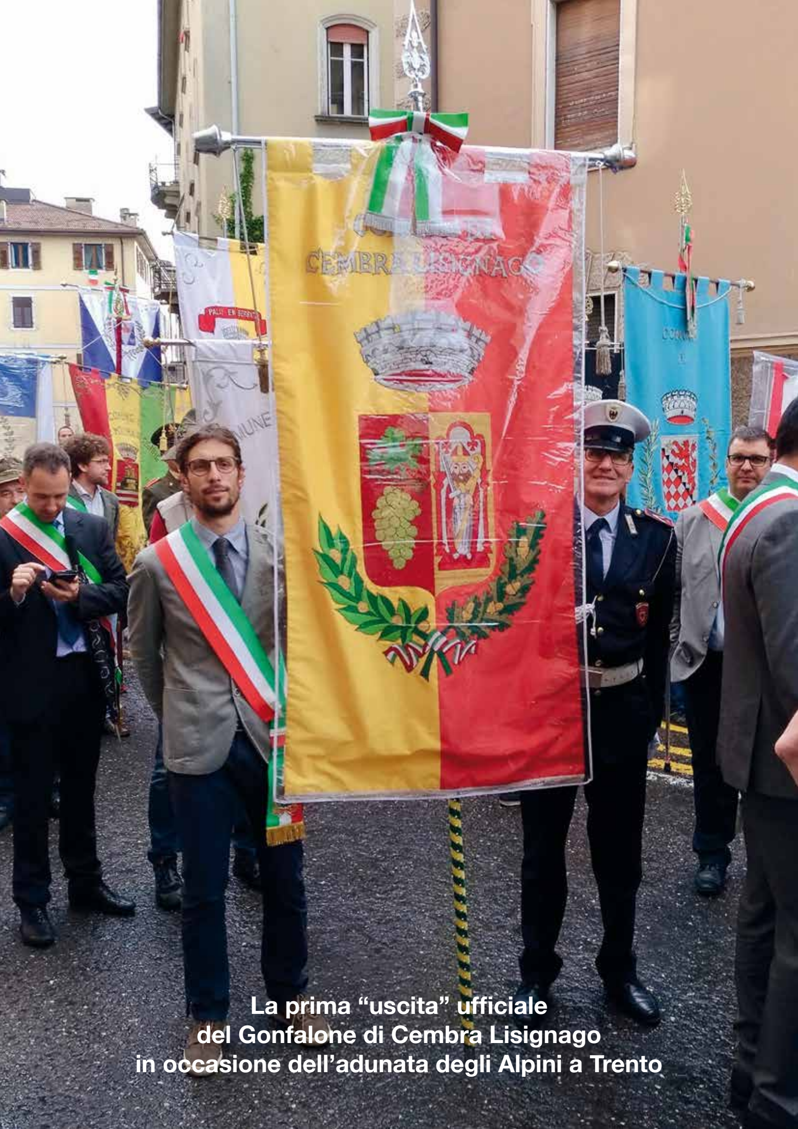
La prima “uscita” ufficiale del Gonfalone di Cembra Lisignago in occasione dell’adunata degli Alpini a Trento