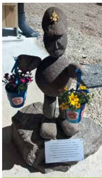
Mascotte dei volontari