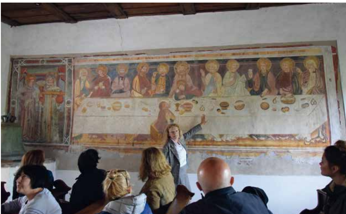
Giornalisti alla scoperta della Valle di Cembra, l'educational Un Sorso di Trentino, maggio 2017: visita alla Chiesa di San Leonardo