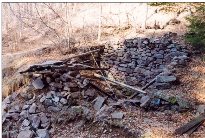
IMMAGINE ORIGINARIA 2012