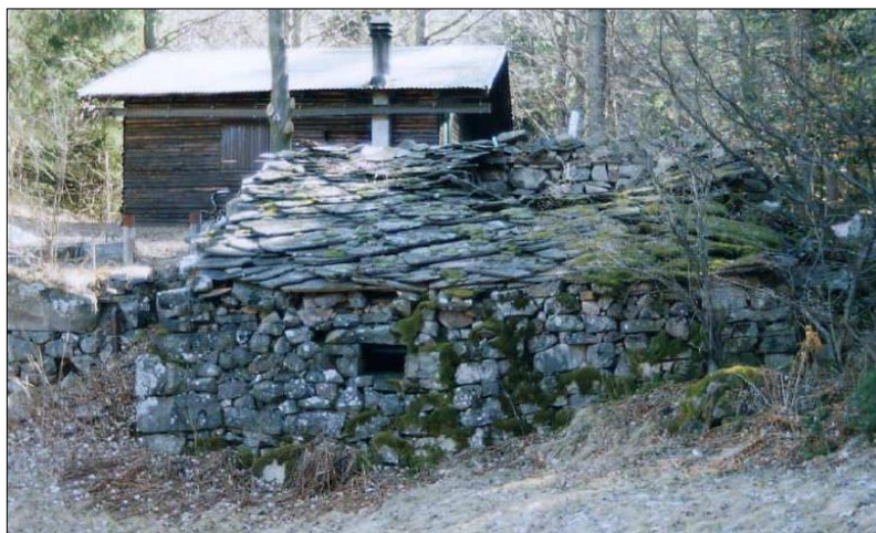
Immagine del 2012

Attualmente il tetto è crollato e rimangono visibili limitate parti