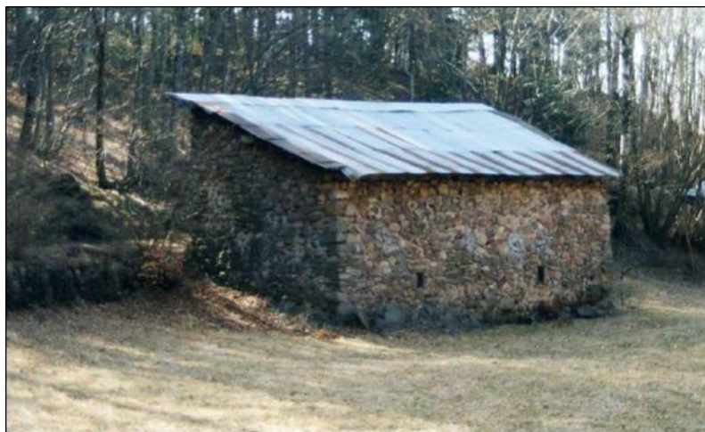
Immagine del 2012