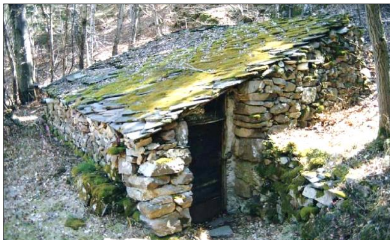
IMMAGINE ORIGINARIA DEL 2012